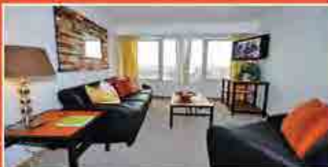
THE TOWER AT 3RD